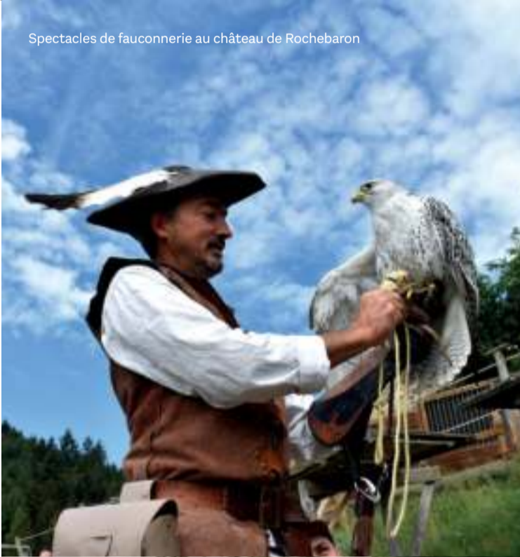
Spectacles de fauconnerie au château de Rochebaron