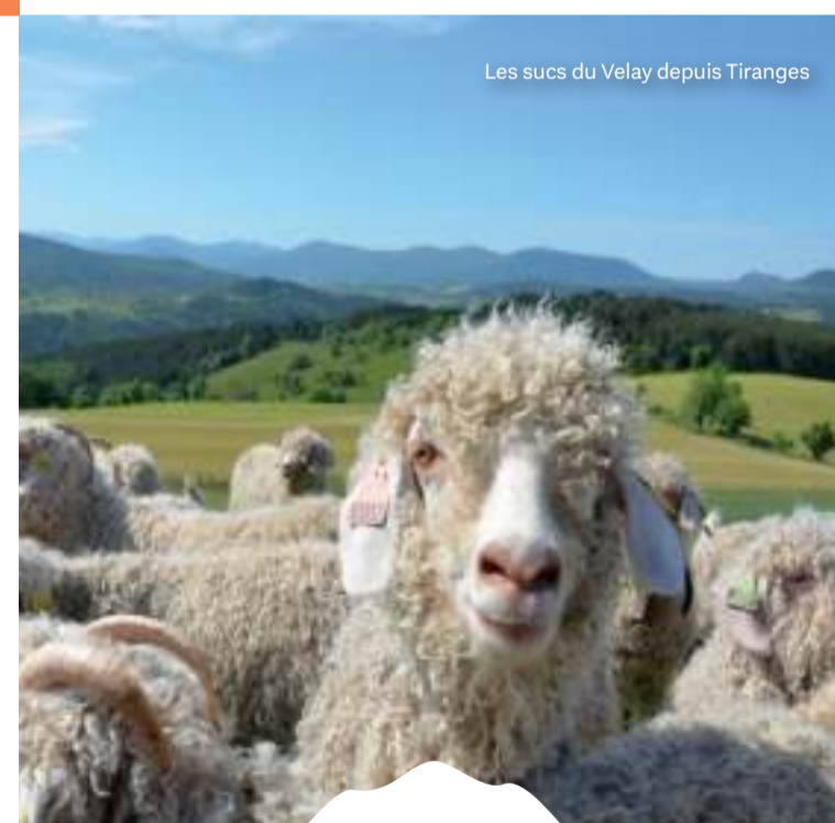
Les sucs du Velay depuis Tiranges

Entre Loire et forêt est un parcours de 2 à 3 jours plus facile et à la portée de tout vététiste malgré quelques passages classés noir. Ces 136 kilomètres vous mèneront, le temps d'un week-end, au cœur de paysages variés et ressourçants !