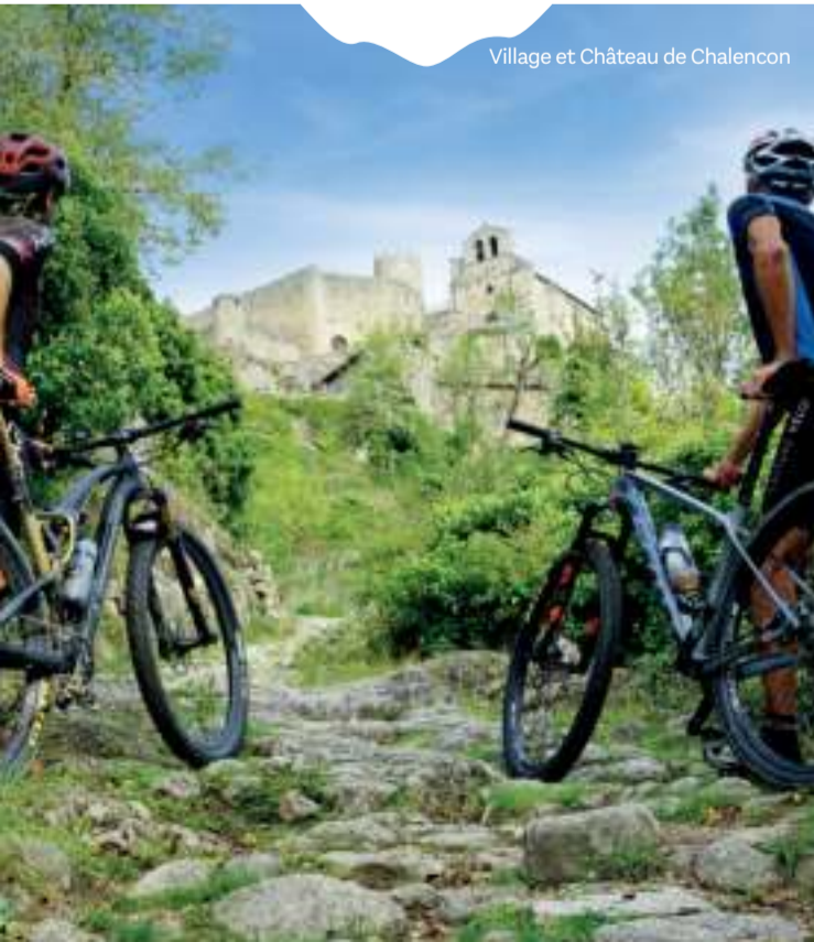
Village et Château de Chalencon

Les PR, sentiers de randonnée pédestre balisés en boucle, sont très nombreux au départ de nos bourgs et villages. De 1h à 6h de marche, ils s'adaptent à tous, du promeneur contemplatif au randonneur aguerri et avide d'efforts !