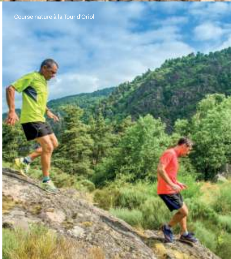
Course nature à la Tour d'Oriol

Une multitude d'activités sont possibles, renseignez-vous dans nos offices de tourisme !