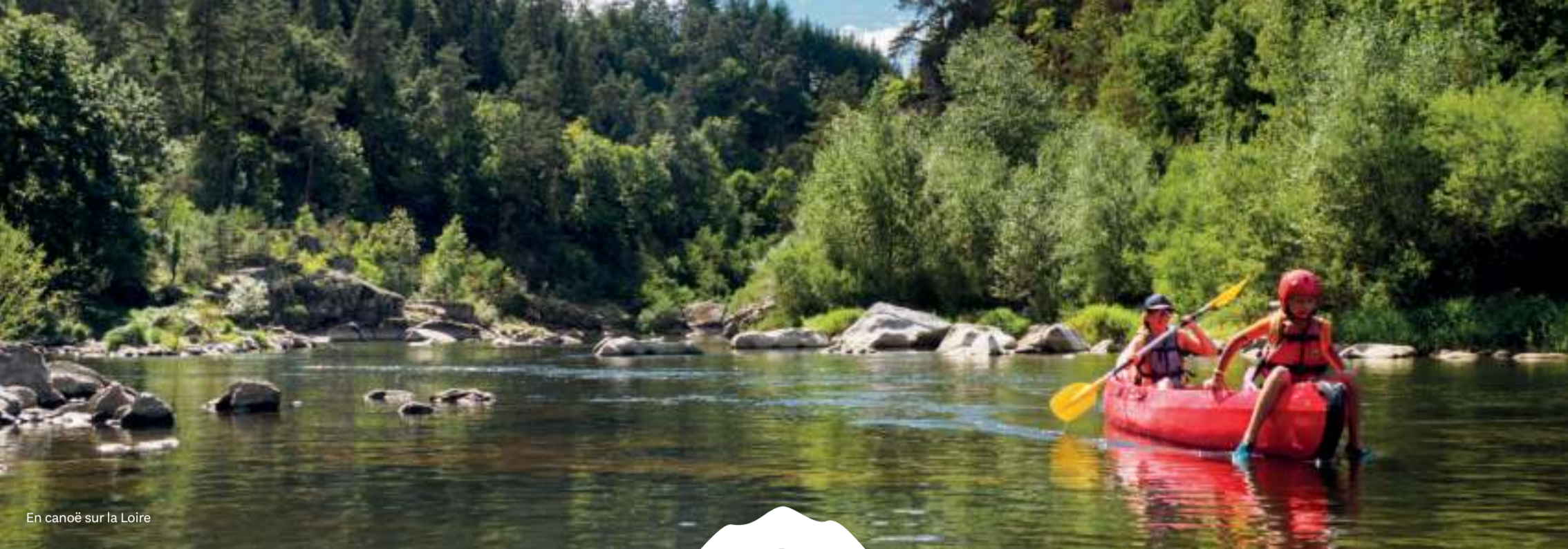
En canoë sur la Loire

Les étangs , et notamment ceux de Bas-en-Basset offrent des espaces de détente pêche, avec une accessibilité facile pour des journées au bord de l'eau. Petit plus, la Loire coule juste à côté. A noter que différents parcours ont été labellisés « sans tuer », « facile » ou « passion » ou encore « à la carpe de nuit ».