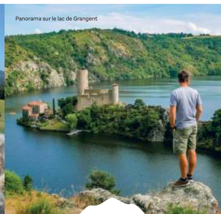
Panorama sur le lac de Grangent