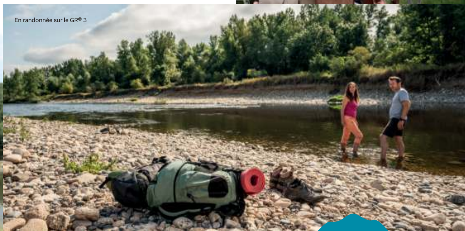
En randonnée sur le GR® 3